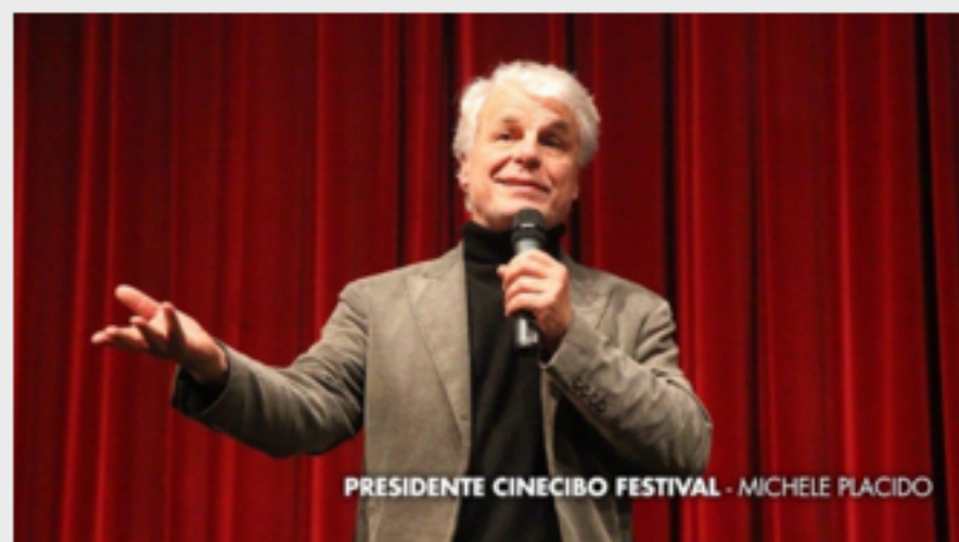
PRESIDENTE CINECIBO FESTIVAL - MICHELE PLACIDO

Articolo inserito il 15/02/2016 alle ore 12.40.35