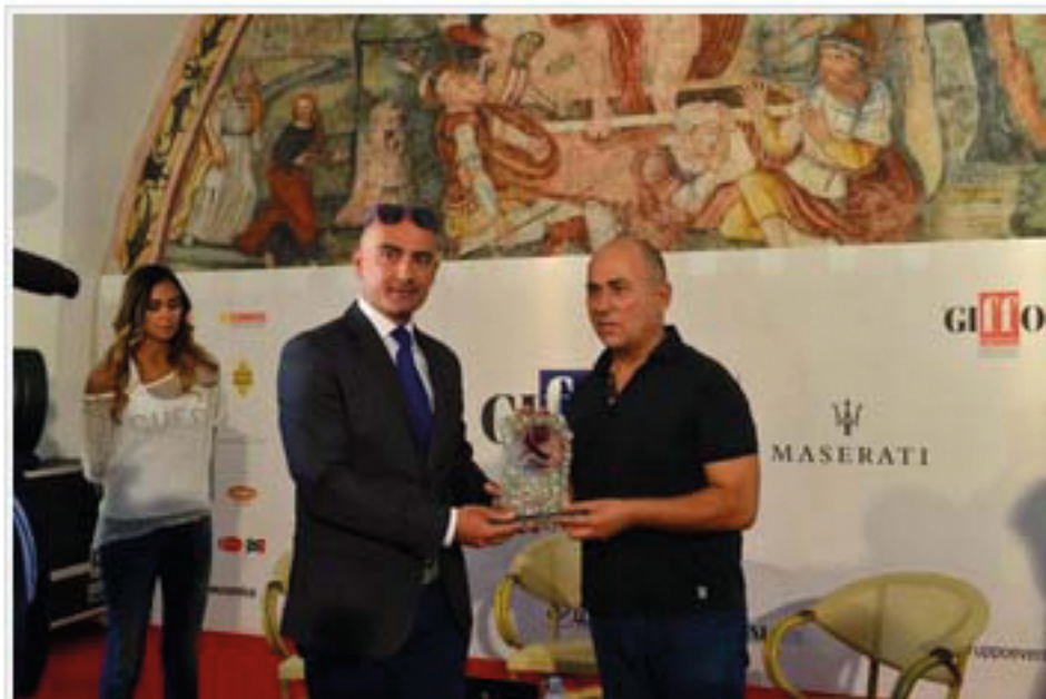
Ferzan Ozpetek e Luca Argentero

Sono stati assegnati al regista Ferzan Ozpetek e all'attore Luca Argentero , in occasione della 44 a edizione del Festival del Cinema di Giffoni – Giffoni Experience, i Premi Cinecibo , ambito riconoscimento legato al cinema e al cibo di qualità attribuito durante i maggiori festival del cinema.